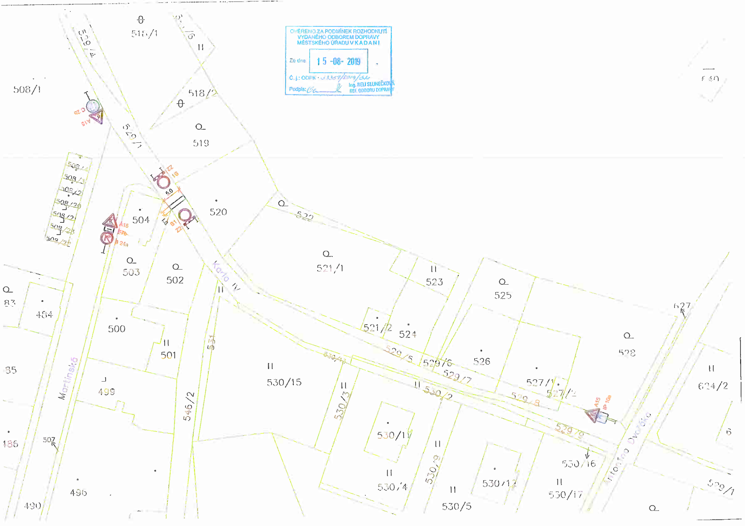
PŘÍLOHA č. 1 k č.j.: ODPK-33357/2019/Slu

OVĚŘENO ZA PODMÍNEK ROZHODNUTÍ VYDANÉHO ODBOREM DOPRAVY MĚSTSKÉHO ÚŘADU V KADAŇI Ze dne: 15-08-2019 Č.j.: ODPK-33357/2019/154 Podpis: [Signature] Ing. BELI SLUNEČKOVÁ REF. ODBORU DOPRAVY